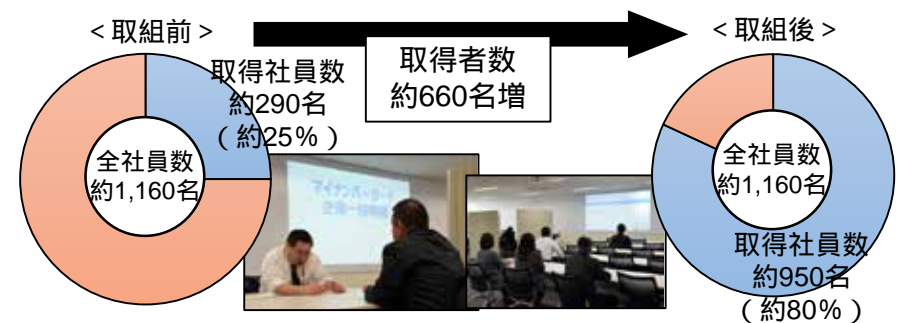
C社のマイナンバーカード取得状況