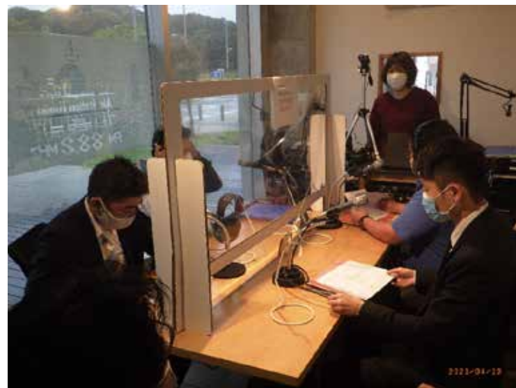
<FMラジオ番組「明日への扉」>